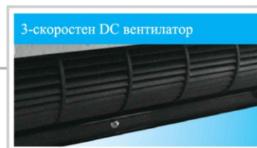
3-скоростен DC вентилатор