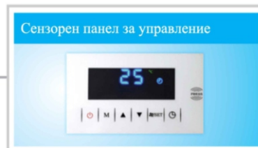
Сензорен панел за управление