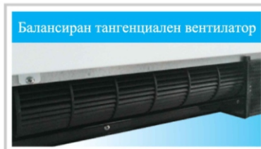
Балансиран тангенциален вентилатор