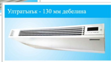
Ултра тънък - 130 мм дебелина