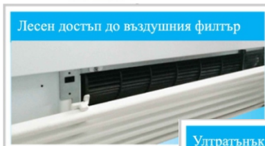
Лесен достъп до въздушния филтър